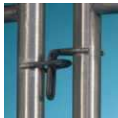
Hák a oko