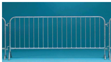
Policejní zábrana F6 250x110