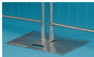
Mobilní základová deska